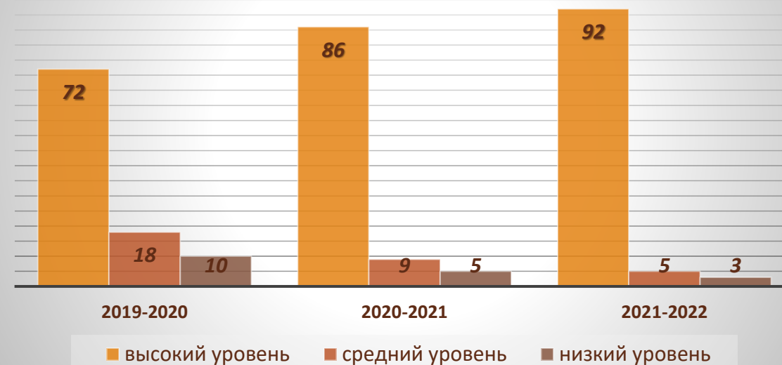
Уровень освоения учащимися дополнительной общеобразовательной общеразвивающей программы «Зоологический калейдоскоп» в разрезе трех лет в процентном соотношении